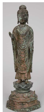
英彦山北岳出土の如来立像（統一新羅時代）