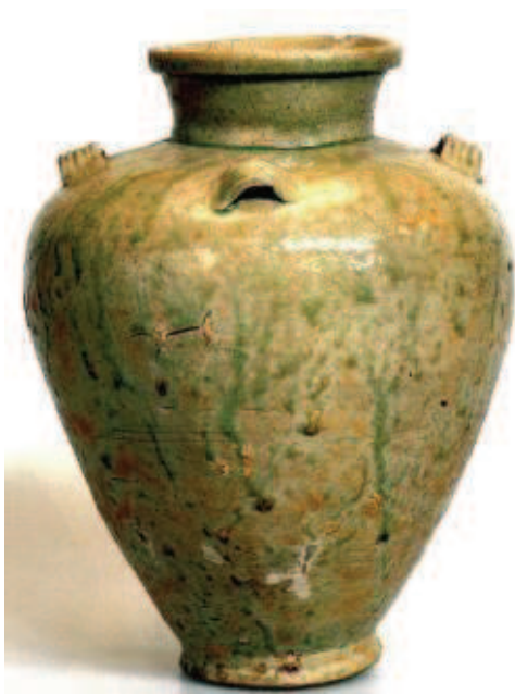
古瀬戸灰釉四耳壺

中世のやきものは、六古窯にみる施釉陶器や生産地特有の焼肌と大らかな造形が古美術品として鑑賞の対象にされがちですが、時代の社会状況や文化の動向と密接にかかわり、当時の人びとの美意識を敏感に反映する生活の器でもあります。