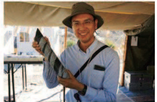
地殻マントル物質 掘削成功！

1990年静岡大学大学院理学研究科修士課程修了。1990年-1993年オーストラリア政府国費留学生。1994年3月ジェームズクック大学博士課程修了。1994年4月-9月日本学術振興会特別研究員PD(東京大学地質学教室) 1994年10月-2002年3月静岡大学理学部・助手、1997年8月-1999年8月日本学術振興会海外特別研究員(フランス・モンペリエ大学)、2000年8月-9月日本学術振興会特定国派遣研究員(フランス・モンペリエ大学) 2002年4月-2007年3月静岡大学理学部・助教授、同理学部地球ダイナミクス講座・准教授を経て教授。2018年4月から名古屋大学教授。