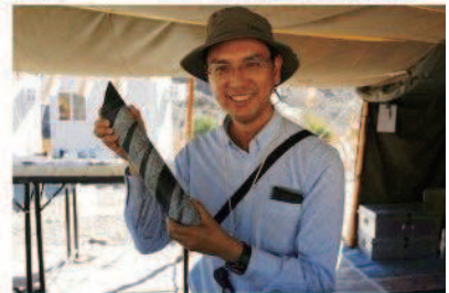
地殻マントル物質 掘削成功！